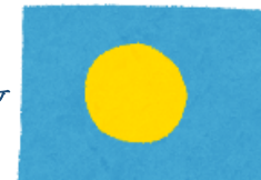
↑パラオ共和国の国旗

《パラオ給食の献立》 ごはん 牛乳 パラオコロッケ 南瓜のココナッツミルク煮 トマトと菜っ葉のスープ