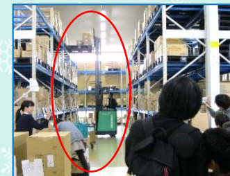
↑フォークリフト作業見学