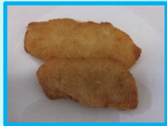
↑白身魚のカレーマヨフライ 40g・50g (茨城冷凍)