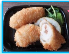
↑茨城県産 梅肉フィロロールかつ 40g・50g (茨城県産フードネットワーク)