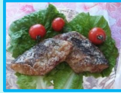
↑トロにしん竜田 40g・50g (清水冷凍)