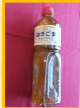
↑ねぎごまドレッシング 1L (エスエスケイフーズ)