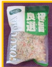
↑5色の乾燥野菜 300g (山海通商)