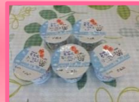
↑そららヨーグルト 85g (小美玉ふるさと食品公社)