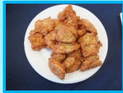
↑加賀揚 業務用 500g (スギヨ)