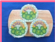
↑青うめゼリー 40g (トーニチ)