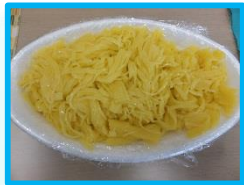
↑やさしい海の極細薄銚黄 1kg (ス*ヒューフーズ)

◆ 2月に、県内7ブロックで平成27年度上半期分物資検討会が行われました。お忙しい中ご参加いただきましてありがとうございます。以下が人気商品です。