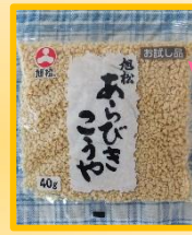
↑あらびきこうや豆腐 500g (旭松食品)

あらびき高野 ・料理にまぜこめて、工夫しだいで使えそうです。 ・挽肉のように使えそうです。