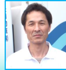
久野 ガーデニング