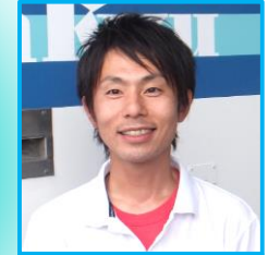
海老沢 バスケット