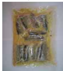
サンマオレンジ煮 (小野食品)