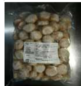
マンナンボール鶏つくね (東亜商事)