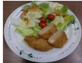
お肉屋さんの里芋コロケ F e強化 (ロイヤルフーズ)