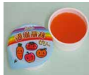
野菜果実ゼリー (トーニチ)