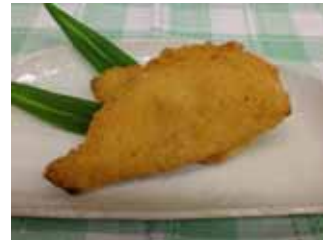
旨鮭みそフライ (茨城冷凍)