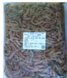
国産ぜんまい水煮 (京菜)