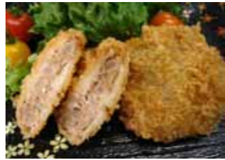
ヤーコンとローズポークのメンチカツ (茨城県フードネットワーク)