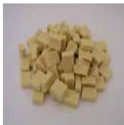
ミニコロカット 高野豆腐 (SN)