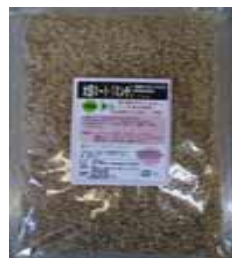
大豆ミート (ミンチ) (藤和乾物)